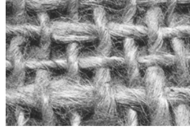
Jutenät JG-500 g/m 2